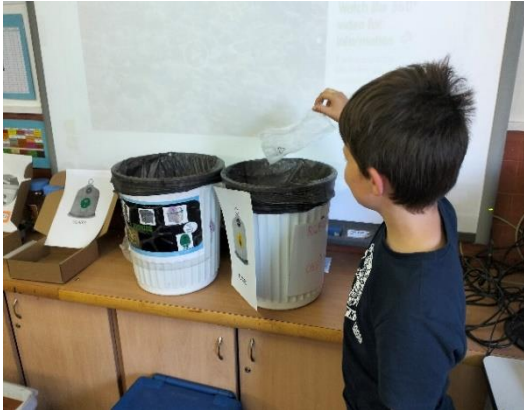
Fundació Privada GEM (Ισπανία)