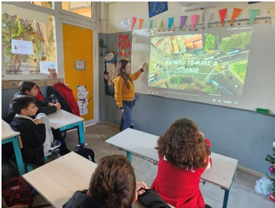
Ιδιωτικό Σχολείο Θεμιστοκλής Α.Ε.(Ελλάδα)