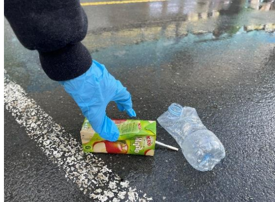
PASCAL Ιδιωτικό Αγγλικό Σχολείο Λεμεσού (Κύπρος)